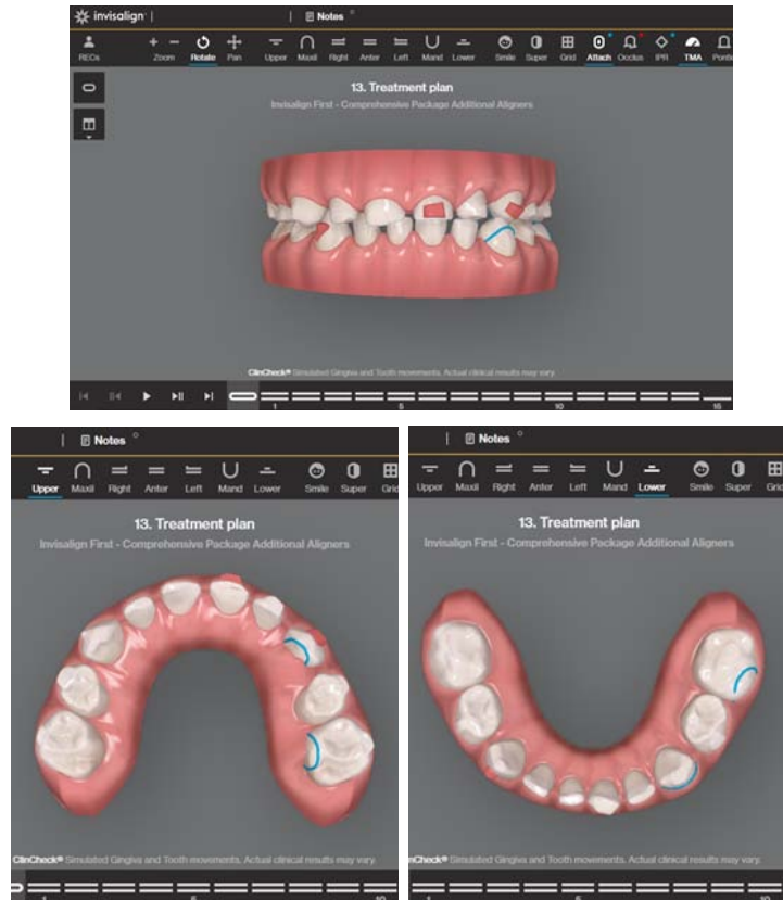
Rycina 5. Kształt łuków przed rozpoczęciem leczenia drugim zestawem alignerów, rozmieszczeni attachmen-tów oraz guzików-widok na Clincheck.

Figure 5. The arch shape before treatment with the second set of aligners, placement of attachments and button cutouts – a view on Clincheck.