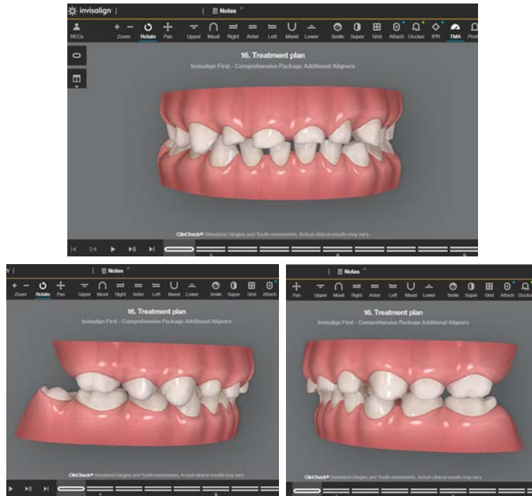
Rycina 8. Stan po odbudowie guzków, zwarcie przed oddaniem ostatniego zestawu alignerów – widok na Clincheck.

Figure 8. Status post the composite restoration of the cusps, occlusion before the last set of aligners – a view on Clincheck.