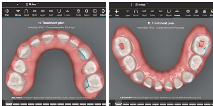
Rycina 4. Asymetryczny kształt łuków zębowych, rozmieszczenie attachmentów oraz wycięć na guziczki do wyciągów criss-cross – widok od powierzchni zgryzowej na Clincheck.

Figure 3. Status before treatment, dental arches relationships and placement of attachments – a frontal view on Clincheck.