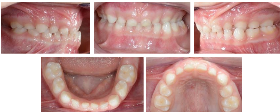
Rycina 2. Zdjęcia wewnętrzne.