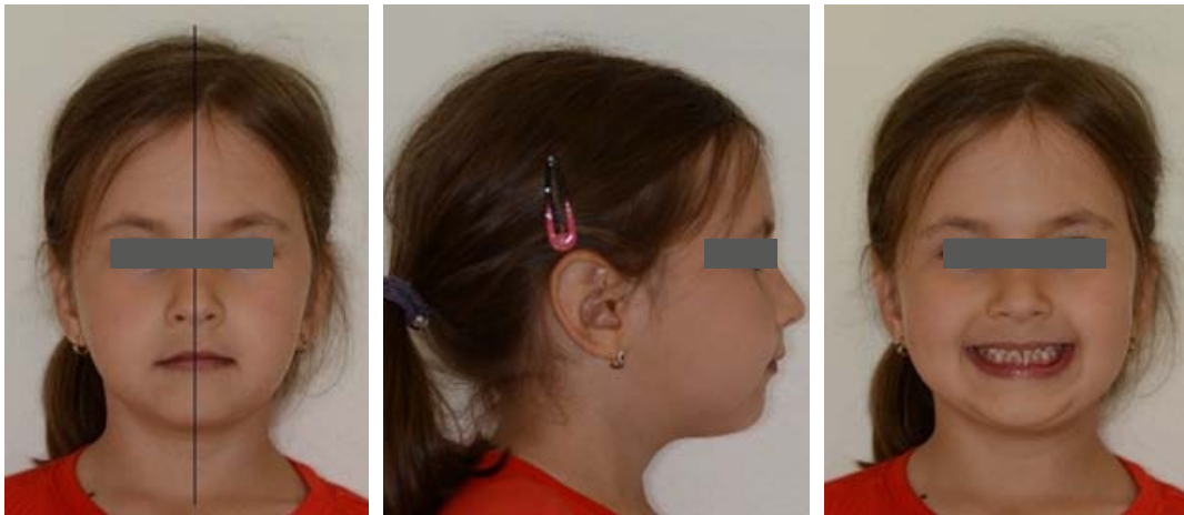
Rycina 6. Zdjęcia zewnętrzne po uzyskanej korekcie zgryzu krzyżowego. Figure 6. Extraoral photographs after achieving correction of the crossbite.