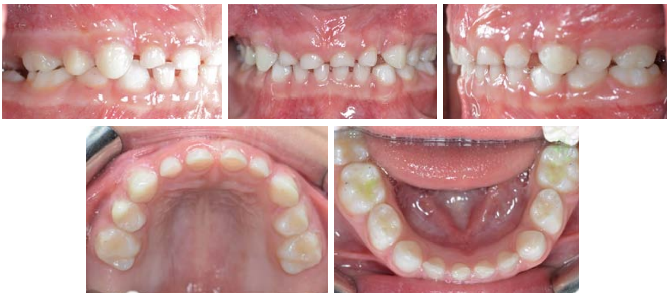
Rycina 7. Zdjęcia wewnętrzne po odbudowie guzków policzkowych zębów bocznych w szczękę. Figure 7. Intraoral photographs after composite restoration of buccal cusps of maxillary lateral teeth.