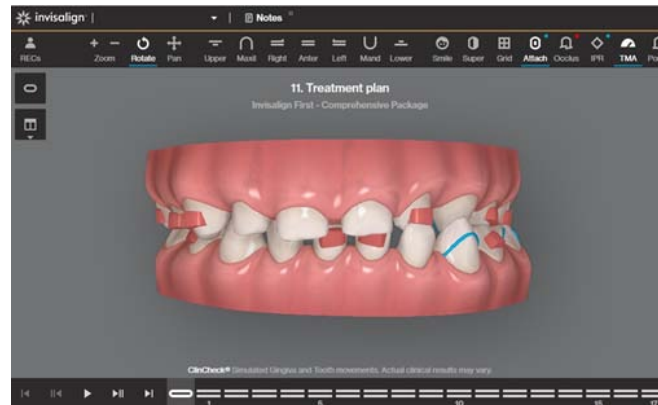
Rycina 3. Stan przed rozpoczęciem leczenia, relacje łuków zębowych i rozmieszczenie attachmentów – widok od przodu na Clincheck.

Figure 3. Status before treatment, dental arches relationships and placement of attachments – a frontal view on Clincheck.